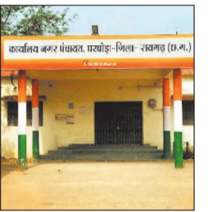
हड़ताल के चलते जलापूर्ति ठप, आम जनता त्रस्त

बताया जा रहा है कि संबंधित कर्मचारियों के हड़ताल पर चले जाने के कारण जलापूर्ति व्यवस्था ठप पड़ी हुई है। पानी नहीं मिलने से महिलाओं, बुजुर्गों और बच्चों को सबसे अधिक दिक्कत हो रही है। सुबह से लेकर देर रात तक लोग पानी की तलाश में इधर उधर भटकने को मजबूर हैं। कई परिवार मजबूरी में हँडपंप, कुएं या निजी स्रोतों से पानी भर रहे हैं, वहीं कुछ