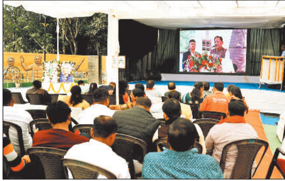
वर्चुअल लोकार्पण के बाद संबोधित करते सीएम और रायगढ़ के अटल परिसर में जनप्रतिनिधि।

मुख्यमंत्री विष्णुदेव साय ने अपने संबोधन में कहा कि श्रद्धेय अटल बिहारी वाजपेयी का संपूर्ण जीवन राष्ट्रसेवा, लोकतांत्रिक मूल्यों और लोकहित के प्रति समर्पण का जीवंत प्रतीक है। मुख्यमंत्री ने कहा कि अटल जी केवल प्रधानमंत्री ही नहीं, बल्कि दूरदर्शी चिंतक थे, जिन्होंने राजनीति को सत्ता नहीं, बल्कि सेवा का सशक्त माध्यम बनाया। छत्तीसगढ़ राज्य का निर्माण उनके ऐतिहासिक