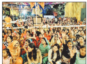
मिथिला पहुंचने पर गीतम ऋषि की पत्नी अहिल्या का श्रीराम के चरण स्पर्श से उद्धार हुआ। जनकपुर में आयोजित शिवधनुष यज्ञ में अनेक राजाओं के बीच श्रीराम ने गुरु आज्ञा से शिवधनुष को उठा कर तोड़ दिया। इसके साथ ही स्पष्ट हो गया कि जनकनिंदी सीता के लिए उपयुक्त वर केवल श्रीराम ही हैं। नगर में विवाह की मंगल तैयारियां शुरू हुईं और धर्म सद्भाव के इस पावन मिलन में अयोध्या के चारों राजकुमारों का विवाह मिथिला की